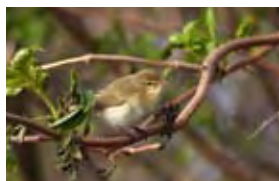
Le Pouillot véloce.