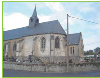
① Le chœur actuel de l'église de Widehem fut construit au 15 ème siècle. Lors de sa restauration au 18 ème siècle, une nef et une sacristie furent ajoutées.