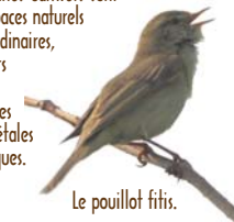
Le pouillot fitis.

⑤ Les pelouses calcaires de Dannes-Carniers sont des espaces naturels extraordinaires, supports de vies animales et végétales prolifiques.