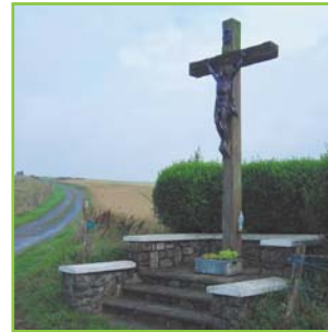
② Calvaire de Widehem implanté au lieu-dit "Le Guernet".